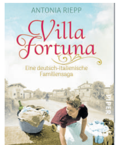
Das Cover von Villa Fortuna.